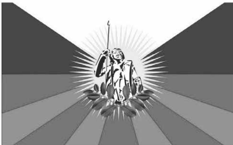
IMAGEN DE LA BANDERA OFICIAL