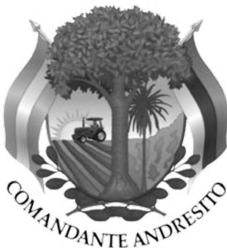
IMAGEN DEL ESCUDO